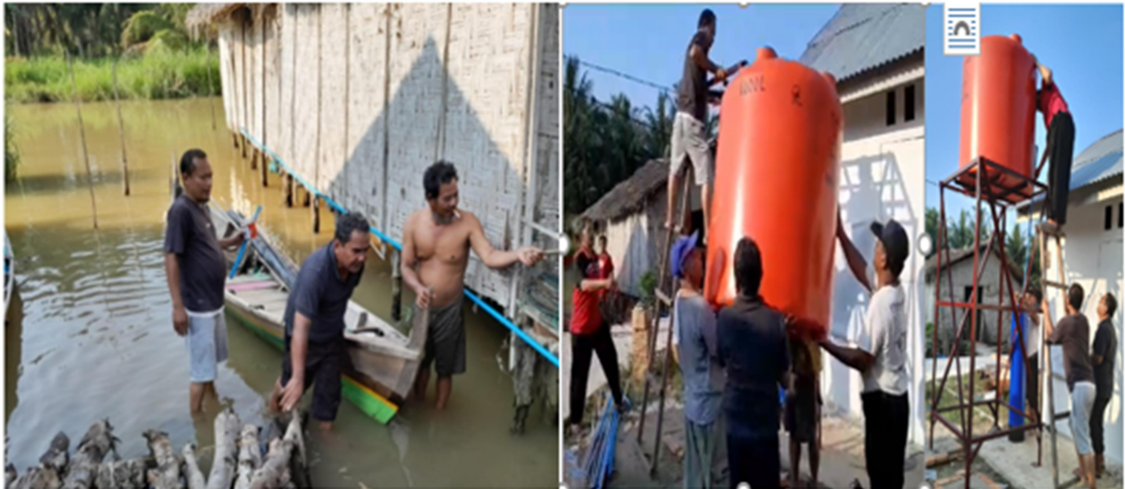
Gambar 1. Pemasangan Instalasi dan Tangki Air

Di Dusun XIII Desa Pematang Cengal, Kecamatan Tanjung Pura Langkat, alat pengolah dan penyaring air hasil PPTTG ini membawa manfaat signifikan. Masyarakat sekarang dapat mengonsumsi air hasil penyaringan, mengurangi ketergantungan pada air isi ulang yang sebelumnya menjadi beban ekonomi bagi sebagian masyarakat berpenghasilan rendah. Sistem instalasi air yang dikembangkan mampu mengolah air baku yang mengandung unsur kimia seperti besi (Fe), mangan (Mn), cadmium (Cd), nikel (Ni), timbal (Pb), air raksa (Hg), dan unsur fisika seperti bau, rasa, warna, kekeruhan, dan total zat padat terlarut (TDS) yang melebihi baku mutu, sehingga menghasilkan air bersih layak konsumsi sesuai dengan standar baku mutu air.