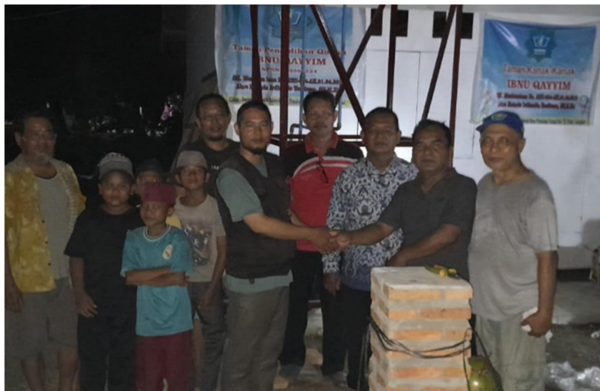
Gambar 3. Serah terima instalasi penyaring air