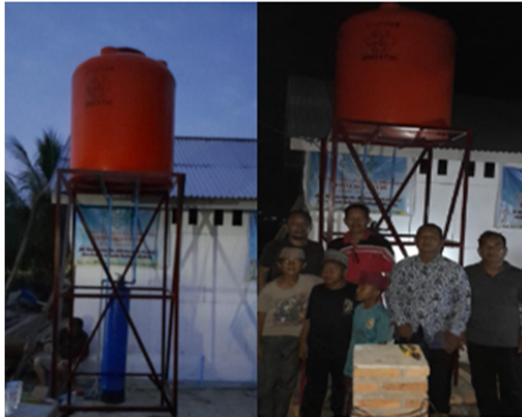
Gambar 2. Instalasi dan Tangki Air Terpasang