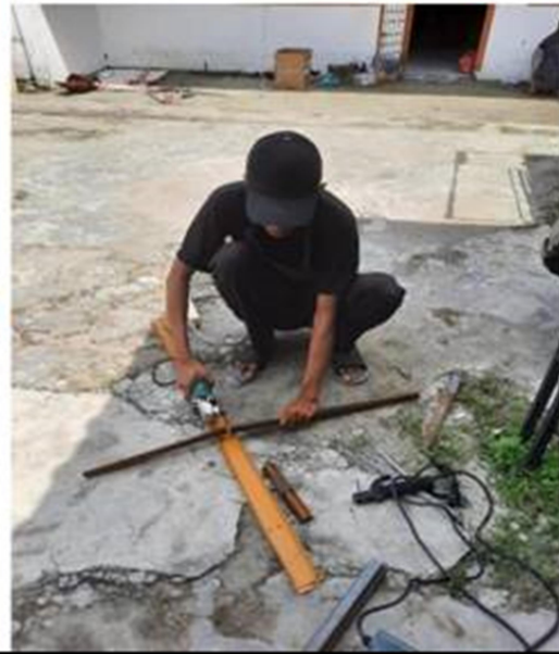
Gambar 3. Pemotongan bahan profil