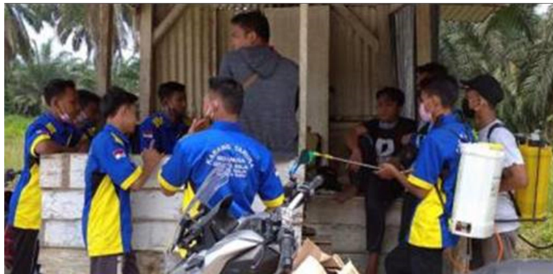
Gambar 1. Karang Taruna Sebanusa

mempunyai pekerjaan tetap. Itu artinya hanya 0.74%.