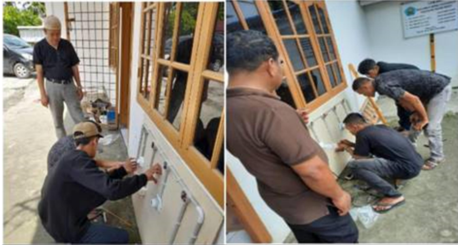
Gambar 5. Praktek instalasi listrik pada papan modul praktek