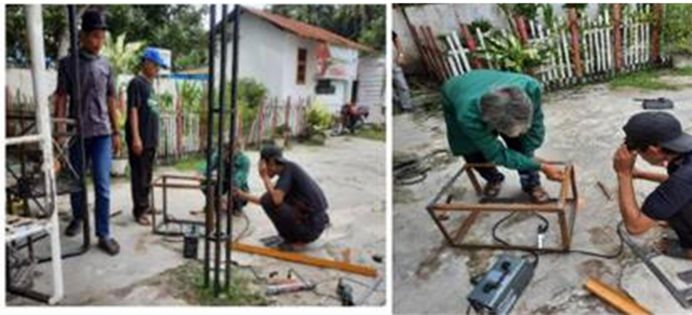
Gambar 4. Praktek pembuatan produk kerangka meja