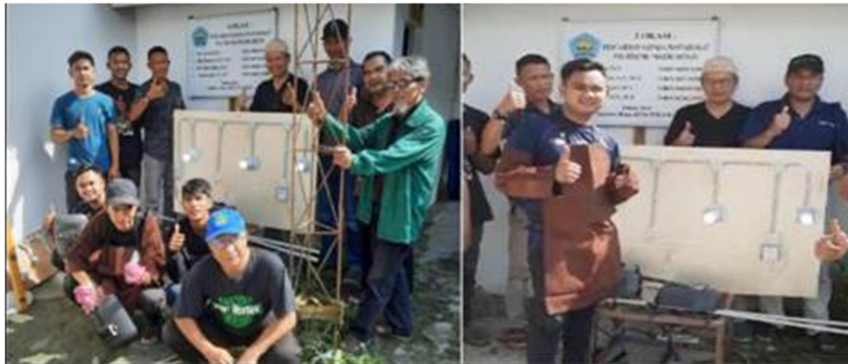
Gambar 6. Hasil praktek instalasi listrik