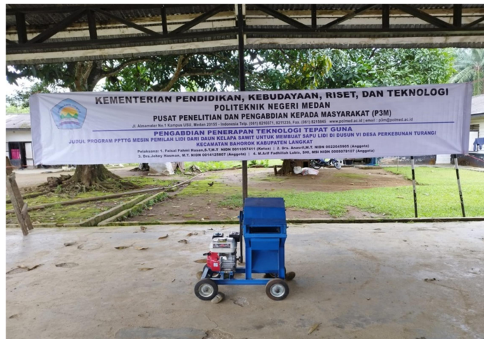
Gambar 4. Mesin Pemilah Lidi yang dihibahkan Kepada Mitra

Sebelum PPTTG dilakukan pemilahan lidi dari daun kelapa sawit dilakukan oleh mitra secara manual dengan pisau yang banyak menghabiskan waktu dan volume produksi terbatas serta rawan kecelakaan kerja karena menggunakan cara tradisional tanpa tersentuh teknologi satu pun. Adapun setelah PPTTG yang menjadi permasalahan mitra selama ini dapat ditangani. Produksi lidi dari daun kelapa sawit sudah meningkat, efektifitas waktu juga bisa dimaksimalkan serta hemat, dan kecelakaan kerja juga bisa dikurangi bahkan dihindari dengan penggunaan mesin pemilah lidi tersebut.