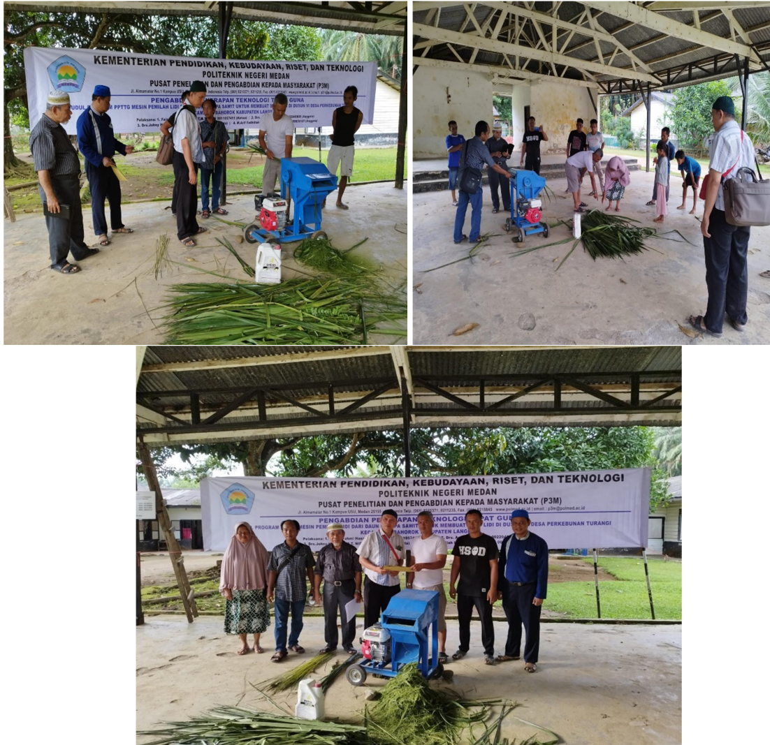
Gambar 5. Dokumentasi Kegiatan Pengabdian

dijadikan 30 sapu lidi jadi banyaknya 1 kg lidi sekitar 6000 batang.