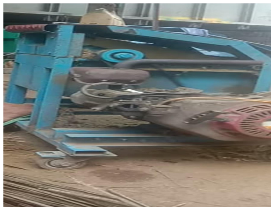
Gambar 2. Pembuatan Mesin Pemilah Lidi