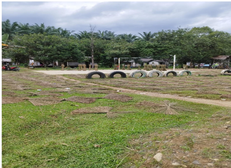
Gambar 1. Pengeringan Lidi dari Daun Kelapa Sawit yang Dimiliki Mitra

Berdasarkan analisa situasi di atas tiga permasalahan yang dihadapi mitra dapat diidentifikasi. Pertama, mitra melakukan aktifitas memisahkan lidi dari daun kelapa sawit masih dilakukan secara tradisional dengan menggunakan pisau. Kedua, mitra belum tersentuh teknologi dalam pemilahan lidi dari daun kelapa sawit sehingga memerlukan banyak waktu dalam produksi lidi. Ketiga, mitra rawan mengalami kecelakaan kerja karena masih menggunakan pisau dalam memilah lidi dari daun kepala sawit.