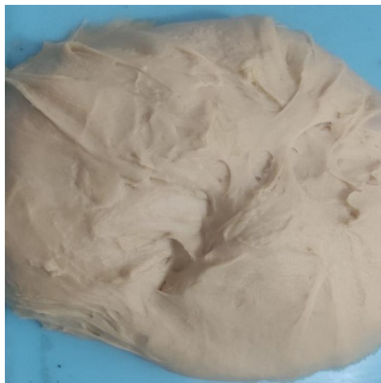
4. Adonan Siap Dicetak

Dari mulai tahapan persiapan sampai tahap pelaksanaan pengabdian masyarakat bias dilihat bahwa proses pengembangan usaha rumahan tidak begitu sulit. Hanya saja pemasaran yang harus ditingkatkan agar usaha dapat bersaing dengan produsen lainnya. Ketika proses pengabdian berlangsung, mitra sangat merasa terbantu oleh tim pengabdian. Bahkan, mitra dan masyarakat yang ada di luaran teladan barat dapat menambah wawasan bagaimana proses jual beli suatu produk yang dibuat di media sosial. Kegiatan proses pengabdian dari memberikan pelatihan sampai membuat donat ditunjukkan oleh gambar 4, gambar 5, dan gambar 6.