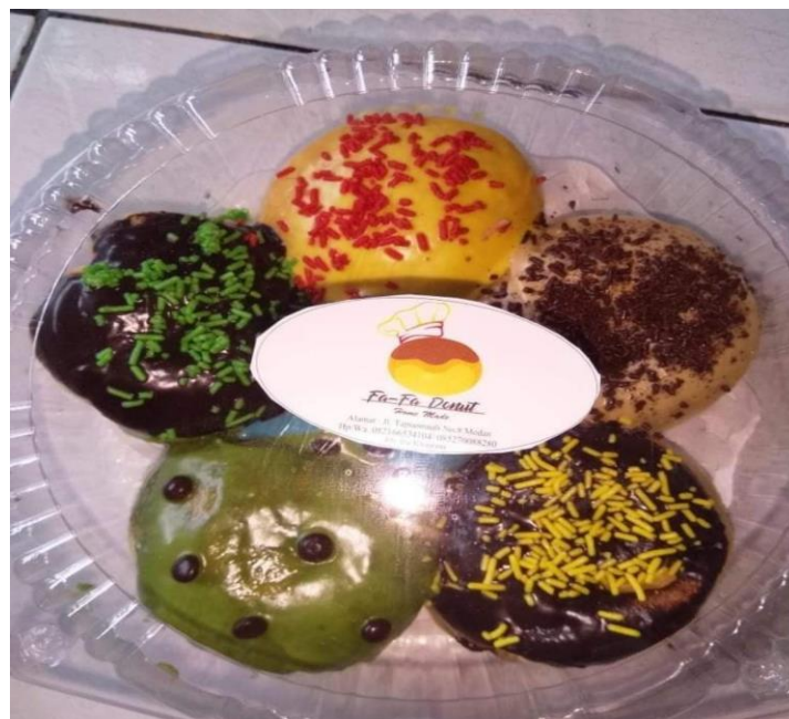
Gambar 1. Kue donat produksi Fafa Donat