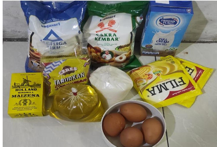
Gambar 3. Bahan pembuat kue

Tahap pelaksanaan yang dilakukan oleh tim pengabdian adalah sebagai berikut.