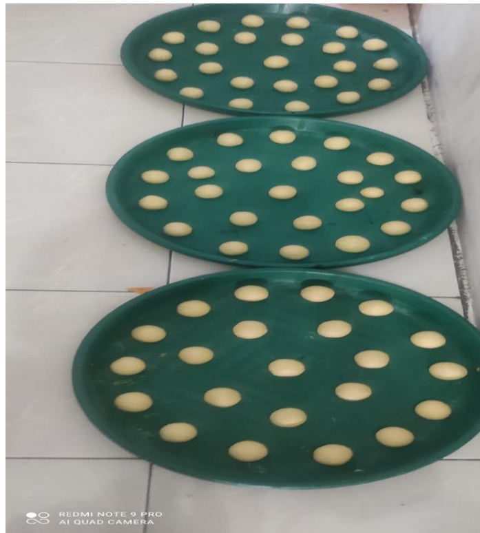
Gambar 5. Adonan Kue Donat