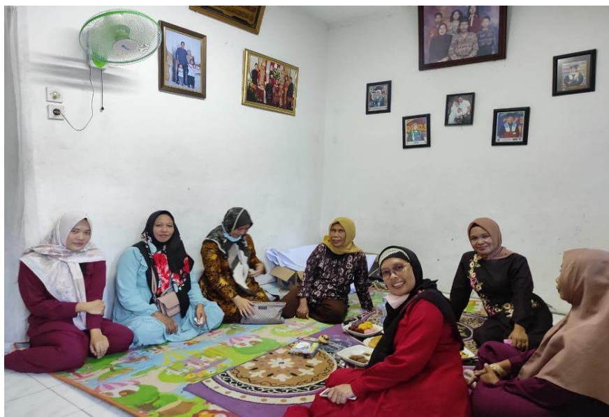
Gambar 6. Melaksanakan edukasi atau pelatihan untuk meningkatkan usaha rumahan