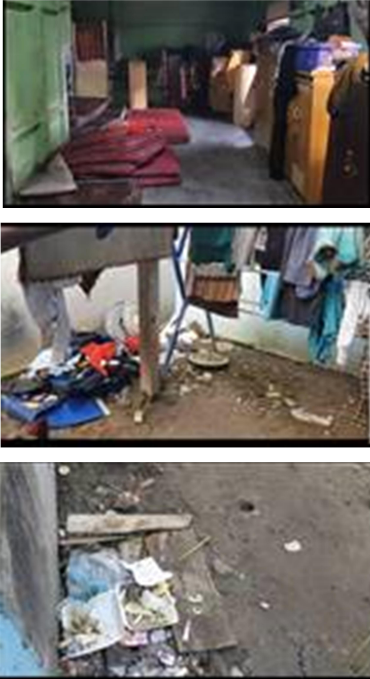
Gambar 1. Kondisi Lingkungan Panti Sebelum Pelaksanaan

Melihat kondisi diatas tim melaksanakan kegiatan pengabdian pada tanggal 27 November 2021 dengan dibantu beberapa mahasiswa. Tim memberikan pelatihan kepada anak-anak panti tentang bagaimana menjaga kebersihan lingkungan tempat tinggal mereka. Lingkungan yang bersih dan rapih akan memberikan rasa nyaman untuk tinggal di