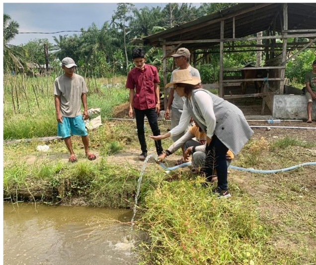
Gambar 6 Pemantauan Kondisi Air Hasil Pengeboran

bor sampai ke bak kamar mandi sejauh \pm 10 m dan dari sumur bor ke lahan pertanian sejauh \pm 15 m. Pompa yang digunakan adalah jenis pompa air Shimizu PS135e 125 Watt otomatis. Hal ini sesuai dengan daya listrik yang tersedia yaitu 1300 watt. Pompa ini berfungsi untuk memompakan air dari dalam sumur bor untuk dialirkan ke bak penampung yang ada di kamar mandi dan lahan pertanian.