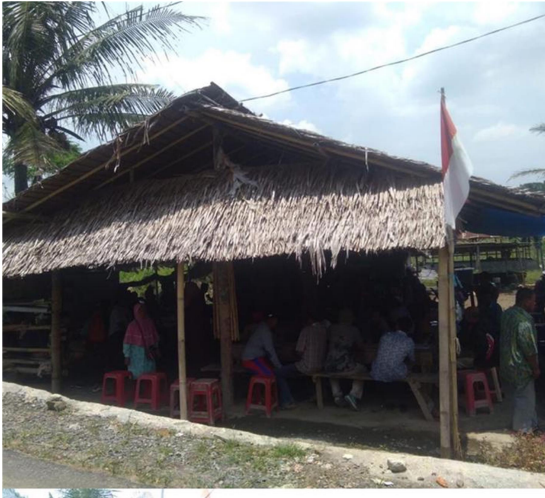
Gambar 1 Bangunan Balai STMB