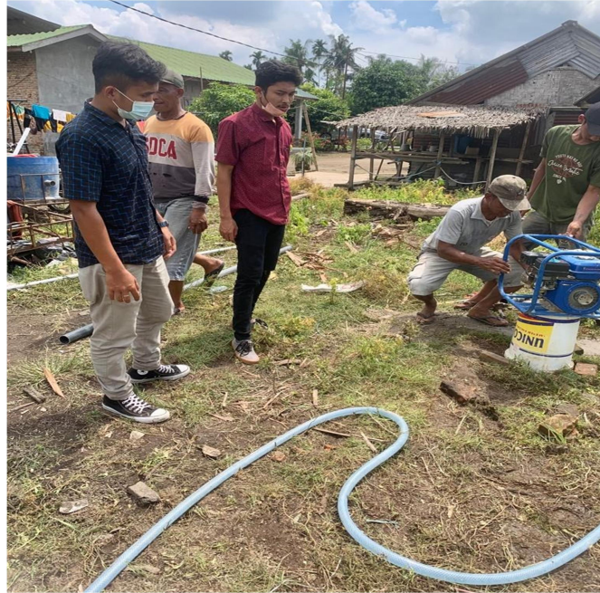
Gambar 5 Proses Pengeboran Sumber Mata Air

Pemasangan pompa dan instalasinya dilakukan oleh tim dan dibantu tenaga ahli pada tanggal 22 Nopember 2021. Kegiatan tersebut dilakukan sampai air bersih dapat dialirkan ke dalam bak penampung di kamar mandi dan ke lahan pertanian serta kolam ikan yang ada di sekitar balai. Air dialirkan menggunakan pipa PVC diameter \frac{3}{4} inci sebanyak 12 batang. Instalasi pipa tersebut digunakan untuk mengalirkan air dari sumur