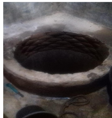
Gambar 3 Sumur air di Balai STMB

Berdasarkan uraian permasalahan mitra di atas dapat disimpulkan bahwa diperlukan sumber air bersih untuk keperluan balai pertemuan STMB dan untuk menyiram tanaman sekitar balai khususnya pada saat musim kemarau berikut dengan instalasinya.