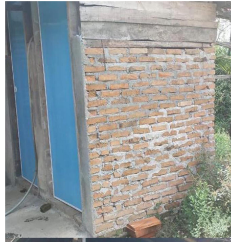
Gambar 2 Kamar Mandi Balai STMB

Penyediaan air bersih untuk balai tersebut dapat di atasi dengan pembuatan sumur bor. Namun, penduduk di desa ini tersebut pada umumnya adalah masyarakat tingkat ekonomi menengah ke bawah. Pekerjaan mereka rata-rata sebagai buruh tani