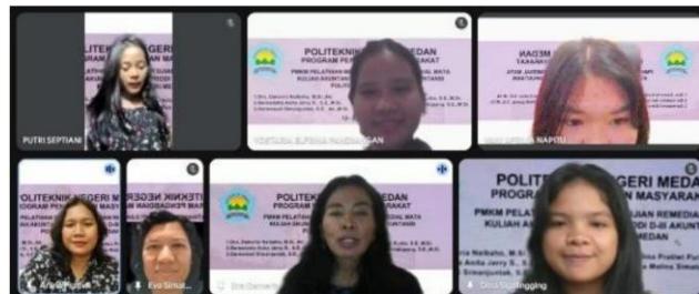
Gambar 3. Foto bersama tim dosen pelaksana dengan peserta penyuluhan setelah kegiatan selesai.

Tahap evaluasi: Untuk dapat mengetahui keberhasilan pelaksanaan penyuluhan, maka dilakukan posttest yang berisi terkait pelaksanaan ujian yang akan dilaksanakan secara offline di Politeknik Negeri Medan, dan hasilnya lebih dari 90% telah memahami bagaimana seharusnya mahasiswa semester 2 prodi D-III Akuntansi Polmed berperan saat mempersiapkan diri untuk melaksanakan ujian remedial. Dari hasil ujian remedial diperoleh ketidak lulusan yang terjadi pada mahasiswa adalah disebabkan ketidak hadiran mahasiswa.