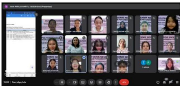
Gambar 1. Penyampaian materi strategi menghadapi ujian remedial oleh narasumber secara daring.

Pelaksanaan penyuluhan sebagai upaya penyadaran mahasiswa dilakukan dengan topik strategi menghadapi ujian remedial bagi mahasiswa Politeknik Negeri Medan Prodi D-III Akuntansi semester 2, selanjutnya diadakan tanya jawab dan diskusi Penyampaian materi dengan cara yang berbeda yaitu melalui pemecahan kasus, soal dan latihanlatihan, juga penguatan ketrampilan belajar dengan teknik mengingat materi yang lebih baik (mind mapping), termasuk peningkatan motivasi dan membangun kembali kepercayaan diri.