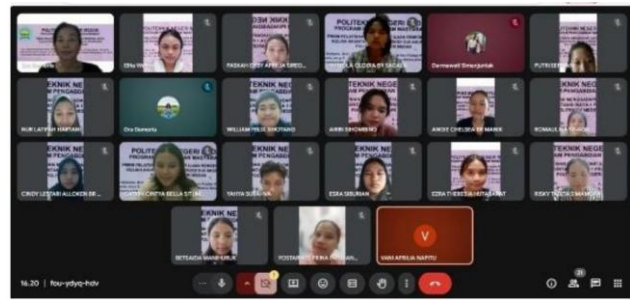
Gambar 2. Antusiasme mahasiswa saat mengikuti sesi tanya jawab dan diskusi.