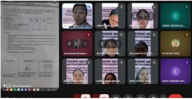
Gambar 5. Suasana mahasiswa mengikuti ujian remedial di kampus Politeknik Negeri Medan.