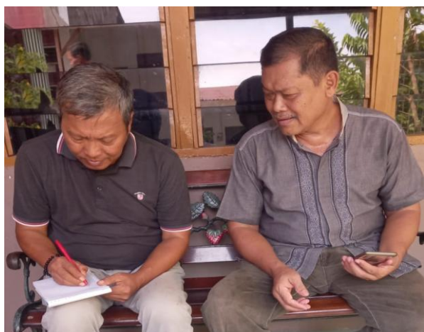
Gambar 2. Mitra mengisi list barang yang dibutuhkan

Pada saat memandikan jenazah pelaksana pemandian membutuhkan beberapa kursi kayu atau bangku kayu panjang sebagai alas duduk penyelenggara untuk memangku jenazah. Bangku panjang tersebut selalu didapat dari meminjam ke tetangga keluarga yang meninggal dunia. Situasi ini secara psikologis tidak sehat baik bagi ketua maupun anggota STM. Walaupun sebenarnya STM ini juga telah memiliki beberapa perlengkapan yang mendukung pelaksanaan perawatan jenazah, tetapi aset (perlengkapan) yang dimiliki STM tidak maksimal.