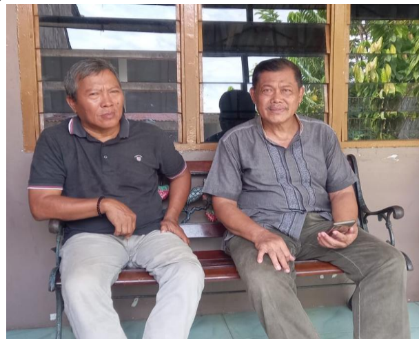
Gambar 1. Saat anggota dan mitra setelah wawancara dalam kunjungan di lokasi mitra

atau jamaah menyebutnya sebagai pengajian. Pengajian dilakukan dengan periode 1 kali dalam sebulan. Menurut penjelasan mitra, nilai positif dari pengajian rutin ini adalah menambah ilmu pengetahuan dan yang paling penting adalah menjaga harmonisasi hubungan antar anggota. Sudah menjadi pengetahuan umum bahwa kehidupan di kota besar saat ini cenderung individualis. Maka majlis dapat dijadikan role model bagi kelompok masyarakat lain. Selain kegiatan rutin terjadwal, STM Amal Sosial juga mempunyai kegiatan insidental yang bersifat wajib. Kegiatan ini dilakukan pada saat terjadi musibah atau kemalangan (meninggal dunia) yang menimpa anggota ataupun keluarga anggota STM. Dalam hal mengurus atau merawat jenazah yang meninggal dunia memerlukan anggota yang terampil dan memahami hukum syariat penyelenggaraan jenazah.