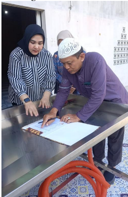
Gambar 4. Penandatanganan Dokumen Serah Terima

Secara lahir dan batin kondisi saat prosesi memandikan jenazah ini menimbulkan rasa tidak nyaman bagi petugas dan bagi anggota STM yang lain. Pihak STM melalui ketuanya bersama tim pelaksana pengabdian Politeknik Negeri Medan berupaya mengatasi kekurangan tersebut dengan mengadakan (membuat) meja mandi jenazah yang terbuat dari bahan baja tahan karat ( stainless steel ). Ukuran meja disesuaikan dengan tinggi rata-rata petugas pemandian dan panjang tubuh jenazah. Dengan ukuran meja, panjang x lebar x tinggi adalah 205 cm x 75 cm x 80 cm, maka petugas dalam melaksanakan pemandian dengan berdiri.