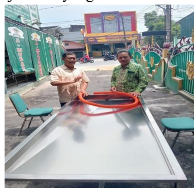
Gambar 3. Meja mandi jenazah bahan Stainless Steel

Setelah menganalisis situasi dan kondisi mitra, maka tim pelaksana menawarkan solusi yang mungkin dapat memecahkan masalah yang dihadapi mitra yaitu mengadakan meja mandi jenazah ukuran standar yang dilengkapi dengan busa berlapis kulit sintesis kedap air. Meja dirancang dengan tinggi 80 cm untuk kenyamanan petugas didalam melaksanakan pekerjaannya. Lebar meja 75 cm dirancang untukantisipasi jenazah yang memiliki badan besar.