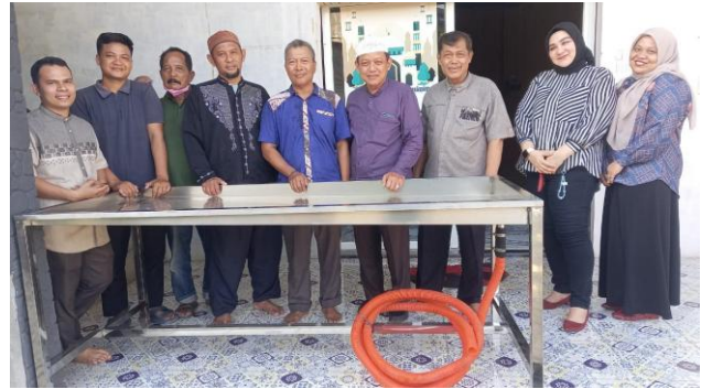
Gambar 5. Serah Terima

pemandian akan merasa nyaman dan tidak memerlukan banyak petugas, pelaksanaan menjadi sederhana dan cepat namun tetap berdasarkan hukum syariat yang benar.