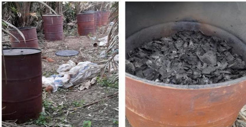
Gambar 1. Proses pembakaran batok kelapa menjadi arang

UD Arang Tempurung, yang dimiliki oleh Bapak Tarsisius Ricard Sembiring dan berlokasi di Desa Ujung Serdang, Kecamatan Tanjung Morawa, Kabupaten Deli Serdang, Provinsi Sumatera Utara, merupakan usaha yang bergerak di bidang produksi arang tempurung kelapa. Usaha ini telah berjalan selama dua tahun, tetapi proses produksi arang tempurung yang dilakukan oleh Bapak Ricard masih tergolong tradisional. Proses pembakaran arang masih menggunakan drum bekas (Gambar 1), sedangkan proses pemisahan serbuk dengan arang masih menggunakan ayakan manual yang dioperasikan oleh dua orang (Gambar 2).