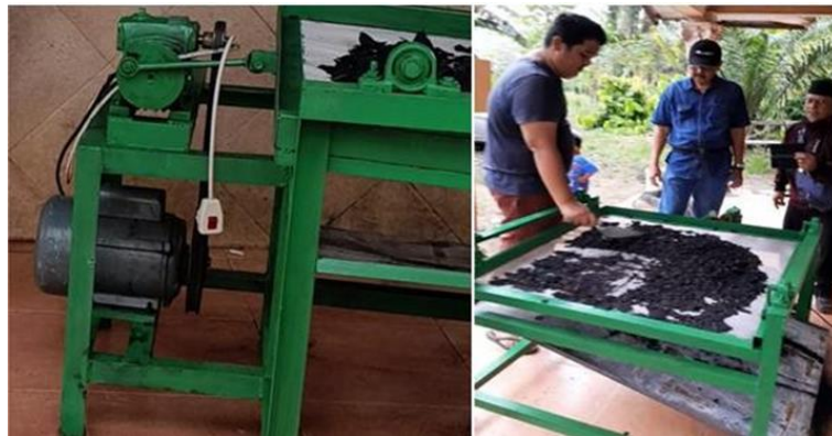
Gambar 4. Mesin pengayak dan arang hasil pengayakan

Mesin pengayak yang dihasilkan menggunakan tenaga penggerak motor listrik (Gambar 4),