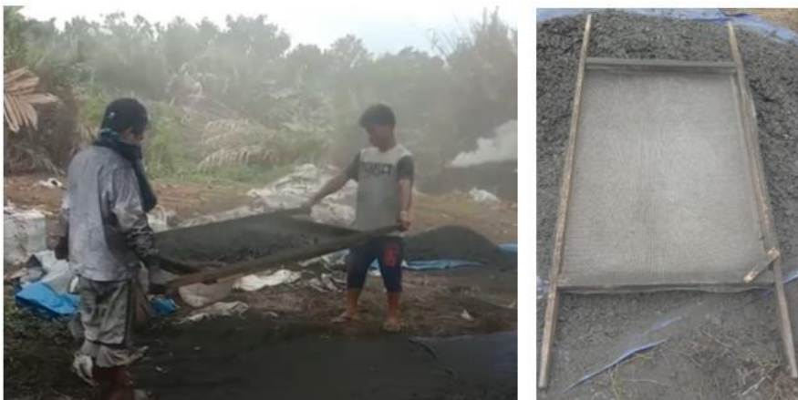
Gambar 2. Proses pengayakan arang dan ayakan manual

arang dan debu yang harus dipisahkan melalui proses penyaringan menggunakan ayakan.